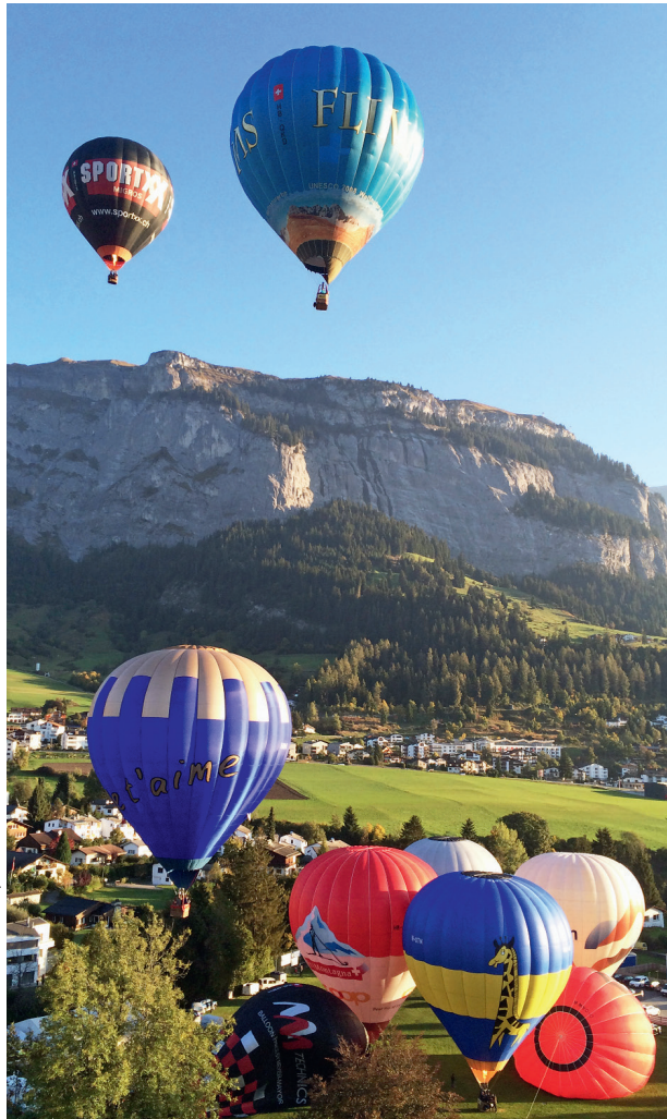
Druck: Samedia Production, Chur

Freitagabend, 6. Oktober 2017, im Festzelt